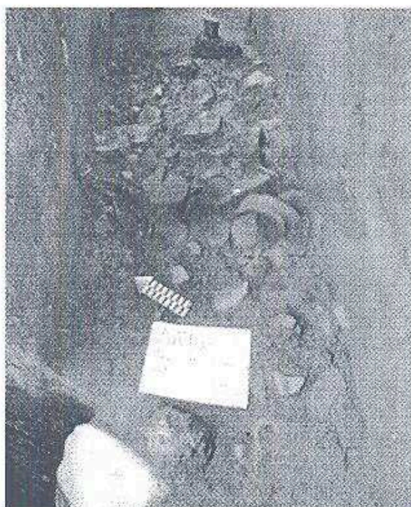
Figura 4. AA9d/8 Depósito de cerámica, lítica y carbón, véase abajo parte del Empedrado (AA9c/7A).