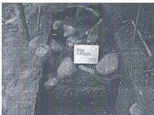
Figura 3. AA9d/6 Empedrado.