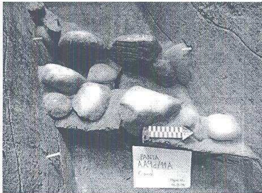
Figura 1. AA9c/11A Canal.